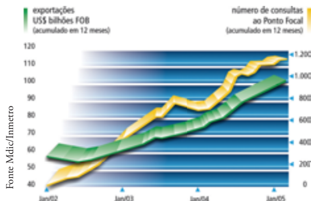
Exportações brasileiras geram aumento nas consultas ao Ponto Focal

Na última década, o Inmetro criou uma infraestrutura na área de metrologia e avaliação da conformidade que permitiu ao país aumentar seu poder de competitividade no comércio exterior. O diretor