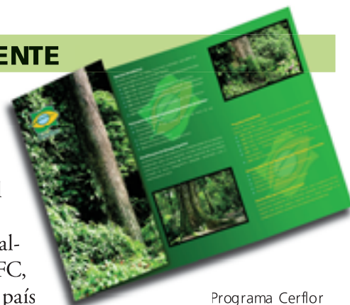
Programa Cerflor www.inmetro.gov.br e www.pefc.org