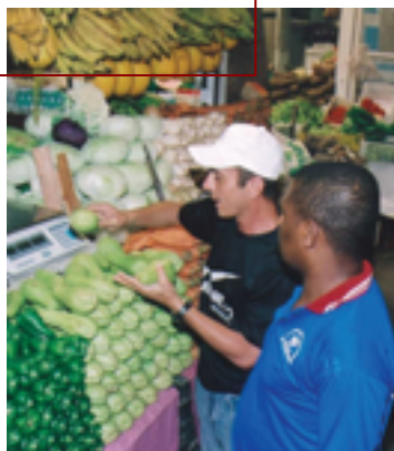
Fiscal do Ibametro orienta consumidores e comerciantes

O trabalho visa educar e conscientizar comerciantes e consumidores sobre a importância de se manter o selo do Inmetro nas balanças e demais instrumentos de medição utilizados nas transações comerciais. O IpeM oferece serviço de atendimento gratuito pelo Disque Ibametro 0800 711888.